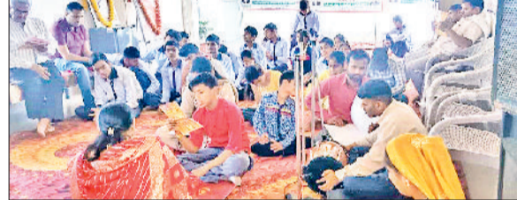
मिवानी। हनुमान जयंती पर संगीतमय सुंदरकांड एवं हनुमान चालीसा करते दिव्यांग विद्यार्थी व शिक्षक।

हनुमान जयंती पर आस्था स्पेशल स्कूल में प्रेरणादायक एवं सराहनीय पहल की शुरुआत की। संस्था ने दिव्यांग बच्चों के लिए निःशुल्क संगीत शिक्षा के लिए आस्था स्वर संगम मंच का विधिवत शुभारंभ किया। इस पहल का उद्देश्य दिव्यांग बच्चों की छिपी हुई प्रतिभाओं को मंच प्रदान करना और उन्हें आत्मनिर्भरता एवं आत्मविश्वास की नई दिशा देना है। कार्यक्रम के शुभारंभ पर विद्यालय परिसर में भक्ति एवं सांस्कृतिक माहौल देखने को मिला। दिव्यांग बच्चों ने