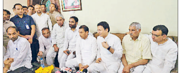
मिवानी। पत्रकारों से बातचीत करते राज्य सभा सदस्य एवं कांग्रेस के वरिष्ठ नेता रणदीप सिंह सुरजेवाला।

राज्य सभा सदस्य एवं कांग्रेस के वरिष्ठ नेता रणदीप सिंह सुरजेवाला के कहा की खेती-विरोधी तीन काले कानून मजबूरन वापस लेने के बाद, अब केंद्र और हरियाणा की भाजपा सरकारें हर रोज चोर दरवाजे से फसलों की एमएसपी खतम करने की साजिश कर रही हैं। जिसका ताजा उदाहरण ताजातरीन रबी फसलों की खरीद को लेकर तुगलकी फरमान। असल में रबी फसल विशेषतः गेहूँ व सरसों की खरीद में अनर्गल