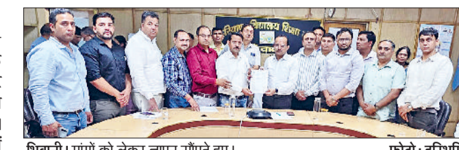
भिवानी। मांगों को लेकर ज्ञापन सौंपते हुए।

कड़ा रख अपनाते हुए कहा है कि यदि बोर्ड ने शिक्षकों की जायज मांगों पर जल्द ध्यान नहीं दिया, तो शिक्षकों में भारी रोष उत्पन्न होगा। धारेडू ने बताया कि एसोसिएशन ने मांगपत्र के माध्यम से मांग की है कि पिछले काफी समय से