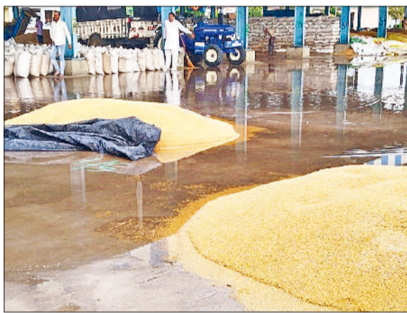
भिवानी। मंडियों में बारिश की वजह से गेहूं की ढेरियों के चारों तरफ फैला पानी और बारिश के साथ तेज हवा चलने से खेतों में बिछी गेहूं की फसल।

फिलहाल पल पल बदल रहे मौसम के मिजाज से किसानों की हार्टबीट बढ़ गई। कई जगहों पर छोटे ओले गिरने की भी खबर है। पूरे जिले में कहीं पर हल्की तो कहीं पर बारिश के साथ हवाएं चली। शाम को करीब साढ़े पांच बजे