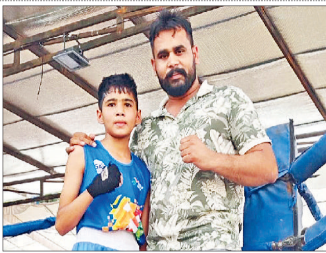
भिवानी। पदक विजेता खिलाड़ी अपने प्रशिक्षक के साथ।